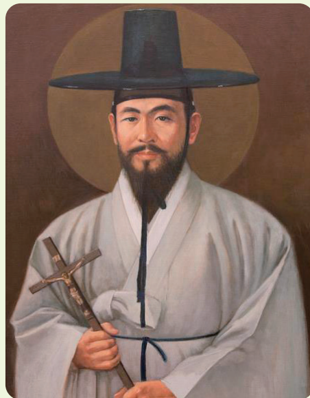
성화_박득순 작, 「한국 103위 순교 성인화 특별전」 © 대구 관덕정순교기념관, 2025

병인박해가 한창이던 1866년 11월, 그는 가족과 마을 교우 30여 명과 함께 체포되었다. 그리고 문경 관아에서 사흘 동안 혹형과 고문을 받았는데, 이때 배교하지 않은 교우들과 함께 상주로 이송되었다. 그곳에서 석 달 동안 또다시 혹형과 고문을 받은 뒤 대구 감영으로 이송되었다. 그는 대구 감영에서 사형 선고를 받은 다음, 여유롭고 기쁜 마음으로 기도하며 지내다가 마침내 1867년 1월 21일, 대구 남문 밖 관덕정에서 참수형을 받아 순교하였다. 그의 나이 45세였다.